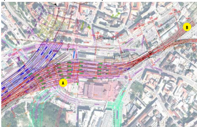
otázka č.14, skica od soutěžícího question Nr. 14, sketch from competitor

retention of these tracks related to any specific phase of transformation of the Brno rail junction or a realised infrastructure project?